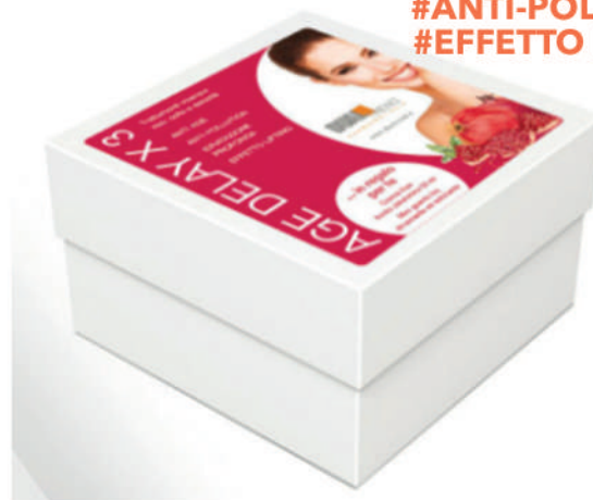
Kit 3 trattamenti

#ANTI-AGE #ANTI-POLLUTION #EFFETTO LIFTING