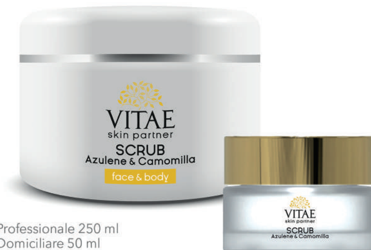
Professionale 250 ml Domiciliare 50 ml