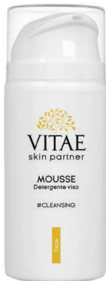
Domiciliare 100 ml