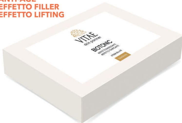
Professionale 10 fiale da 5 ml

#ANTI-AGE #EFFETTO FILLER #EFFETTO LIFTING